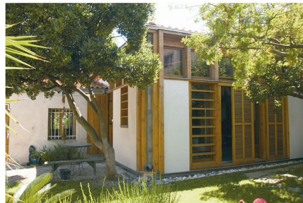
Vue générale de l'extension bois.