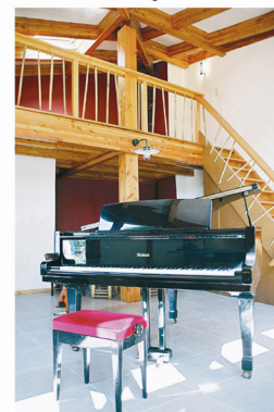
UN LIEU DE MUSIQUE