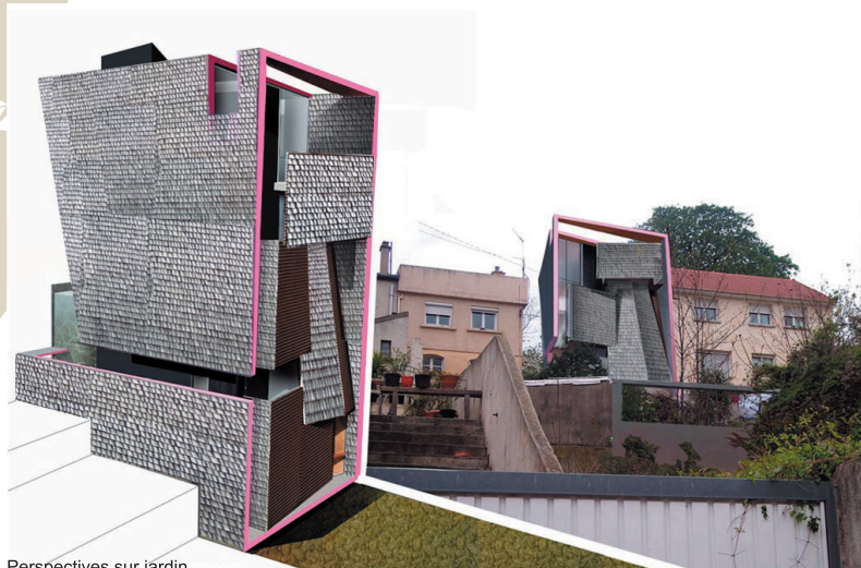
Perspectives sur jardin